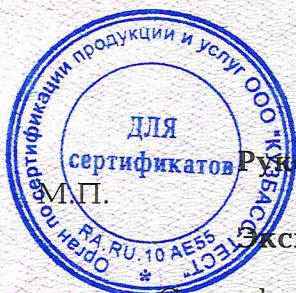
Схема сертификации № 2.

НА ОСНОВАНИИ Протокол проверки оказания услуг № 328 от 06.12.2016 г., акт оценки оказания услуг № 328 от 06.12.2016 г. ОС ПП и У ООО «КУЗБАСС-ТЕСТ»